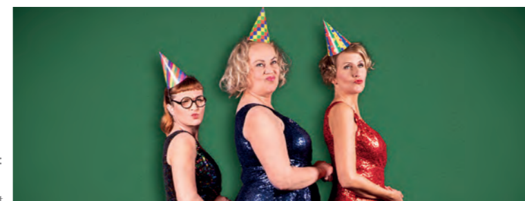
Beim Mädelsabend: Drei Freundinnen tun, was Frau so tut.

Zu einem heißen „Mädelsabend“ lädt ab Ende Oktober die Bielefelder Komödie am Klosterplatz ein. Jedes Jahr treffen sich die Freundinnen Anke, Bärbel und Claudia zu einem feuchtfröhlichen Wochenende, um die Gläser klingen zu lassen, über Männer zu lästern und zu tun, was „Frau“ so tut.