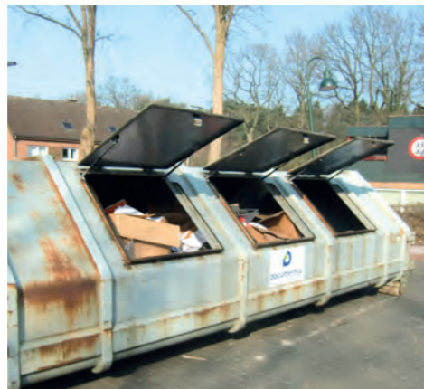
Für sensible Dokumente: Die Spezialtonnen sehen nicht wirklich vertrauenserweckend aus, die sichere Vernichtung der Unterlagen wird aber gewährleistet.

Alte Kontoauszüge und vertrauliche Akten, die nicht mehr benötigt werden, sollte man nicht einfach in die Tonne treten. Das könnte auch rechtliche Folgen haben. Aber wohin mit dem sensiblen Zeug?