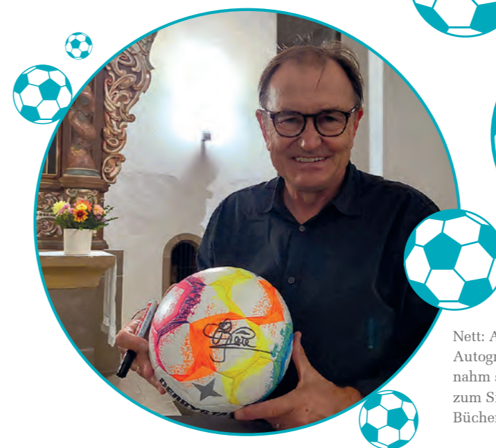
Nett: Auch wenn er Autogramme ablehnt, nahm sich Lienen Zeit zum Signieren von Büchern und Bällen.

gen regelrecht in Rage, aber auch Friedrich Merz regt ihn auf. „Sie müssen mich bremsen, wenn ich zu sehr über Politiker schimpfe“, sagte Lienen, aber keiner der Zuhörer möchte ihn unterbrechen.