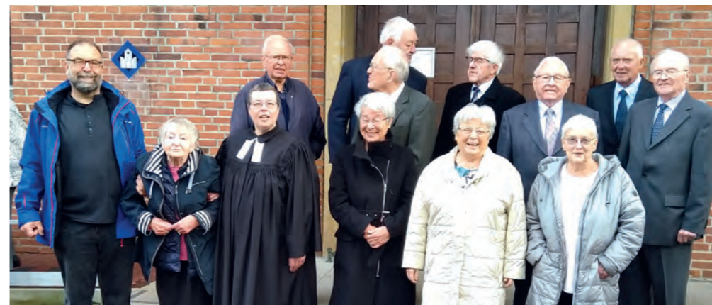
Lange ist es her: Diese Jubilare wurden bereits vor 70 Jahren konfirmiert.

Ihr Jubiläum gefeiert haben diese evangelischen Christen: