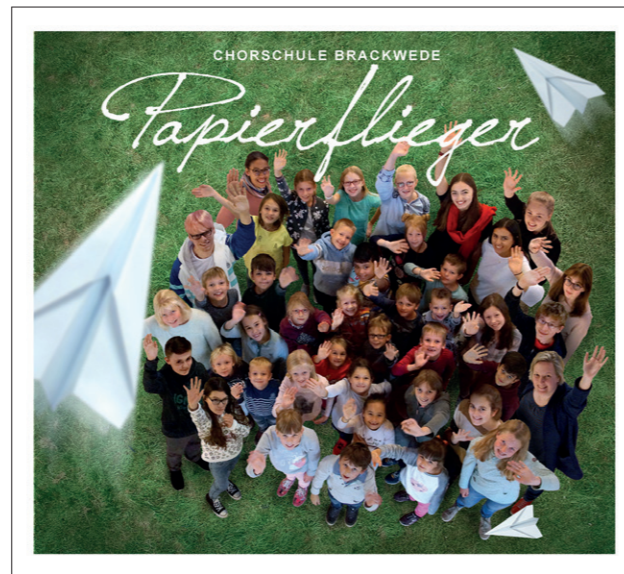
Gut zu hören: Die CD „Papierflieger“

Neben Klassikern des Chorrepertoires und altbekannten Liedern zum Schmunzeln wie „Meine Oma fährt im Hühnerstall Motorrad“ sind auch Gospels und Spirituals zu hören. „Like a Motherless Child“ hat hier einen besonderen Stellenwert: Lucy