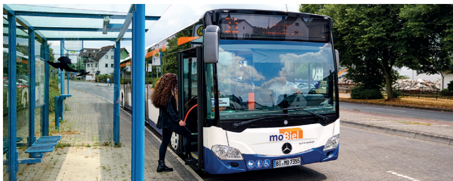
Gib Gas: Künftig geht's noch schneller zum Jahnplatz.

Die gute Nachricht für alle Fans des ÖPNV: Brackwede soll künftig noch besser per Bus und Bahn mit Bielefeld verknüpft werden. Wie in der Bezirksvertretung Brackwede kürzlich erfreut zur Kenntnis genommen wurde, wird es erste Verbesserungen – vor allem für den Ortsteil Quelle – bereits ab 2021 geben.