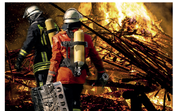
Die Feuerwehr im Einsatz.

Um zehn Uhr wurde Alarm geschlagen, kurz darauf tauchte das erste Einsatzfahrzeug an „Egons Hütte“ auf. Diese war laut Szenario in Brand geraten, nachdem ein Grill umgefallen und es zu einer Verpuffung gekommen war. Das Feuer schlug über in den Wald und breitete sich nördlich der Hünenburgstraße in Richtung Kammweg aus.