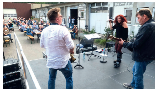
Biergartenatmosphäre: Bei der Reihe „Picknick und Musik“ gab es Live-Musik bis zum Abwinken.