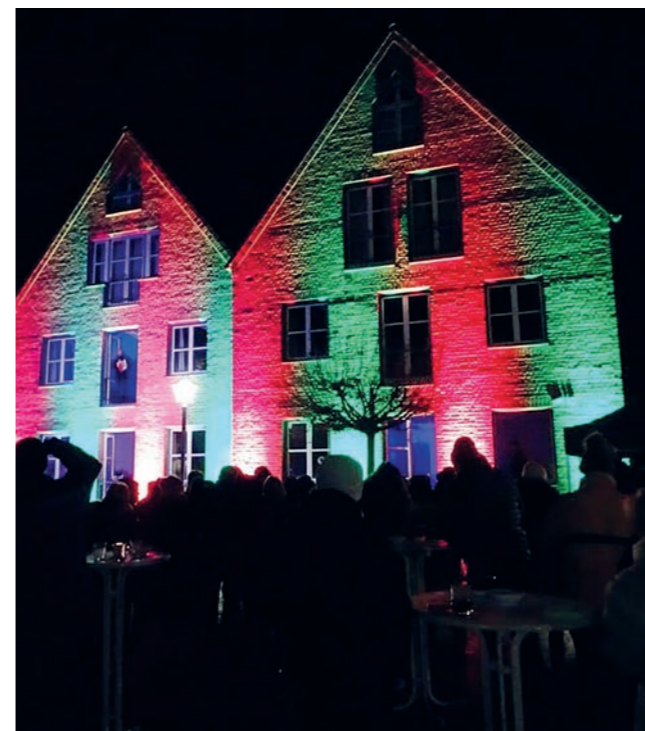
Stimmungsvoll: Mit einer bunten Lichtshow auf dem Kirchplatz wird der Adventskalender der Vielfalt eröffnet.

Der mittlerweile dritte „Brackweder Adventskalender der Vielfalt“ bietet wieder ein beeindruckendes Programm – trotz Corona. An fast jeden Tag des Advents öffnen die beteiligten Akteure für ein paar Stunden ihre Türen und präsentieren sich mit einer kleinen, individuellen und weihnachtlichen Aktion. Leuchtende Höhepunkte im Advent sind neben der bereits erwähnten Lichtershow das Fensterstimmen-Konzert am Nikolaustag, Samstag, 6. Dezember sowie zwei weitere Videoprojektionen an Brackweder Gebäuden.