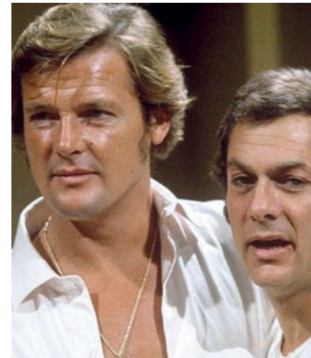
Die Zwei: Roger Moore und Toni Curtis.

(Tony Curtis) trug einen Bomberkoffer fest an Armgelenk, und sein adliger Kumpel Lord Brett Sinclair (Roger Moore) versuchte das Schloss zu öffnen. Danny Wilde (Tony Curtis) kommentierte das mit „ich kann ja nicht rumlaufen wie ein Vertreter aus Brackwede“. Am nächsten Morgen in der allgemeinen Sprüchediskussion kam natürlich die Frage auf: wie um alles in der Welt kommt Brackwede in eine englische Fernsehserie?