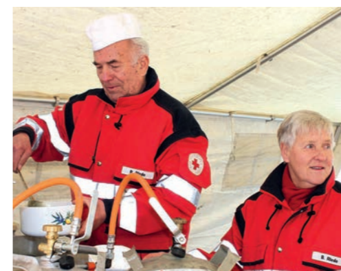
Heiß und würzig: Die berühmte DRK-Erbsensuppe wird stilgerecht in der Gulaschkanone gekocht.

Es sollte ein besonderes Jubiläumsjahr werden, um das 10-jährige Bestehen des DRK Kaufladens in der Treppenstraße 13 in diesem Jahr zu feiern. Vieles, was im Vorfeld an Aktionen und Aktivitäten geplant war, konnte bisher leider nicht stattfinden. Daher hat sich das DRK Brackwede-Senneraum nun eine Herbst-Aktions-