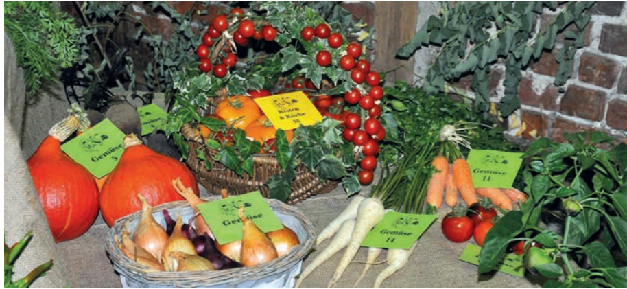
Einladend: Das schön präsentierte Gemüse strahlte in den schönsten Herbstfarben.

Im Corona-Jahr 2020 ist alles anders: So standen auch für die jährliche Geflügel-, Obst- und Gemüse-Ausstellung des „Geflügelzucht- und Gartenbauvereins Ummeln und Umgebung“ in diesem Jahr ganz neue Herausforderungen auf dem Plan. Ausgerechnet zum 95-jährigen Bestehen des Vereins war schnell klar, dass die Veranstaltung nicht wie gewohnt in der Sporthalle am Quittenweg stattfinden konnte. Umso schöner war es für die Mitglieder, dass dem Ummelner Verein die Möglichkeit geboten wurde, ihre diesjährige Ausstellung auf dem