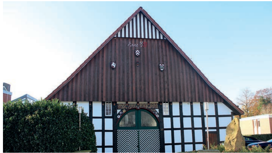
Neuer Wirt: Im ehemaligen Restaurant „1550“ gibt es demnächst Leckerer aus Bella Italia.

Erst ließ uns das Glück im Stich, und dann kam auch noch Pech dazu. So oder so ähnlich könnte das Klagelied der Wirte gelautes haben, die in dem wunderschönen alten Fachwerkhaus an der Hauptstraße 27 gescheitert sind. Innerhalb kurzer Zeit wech-