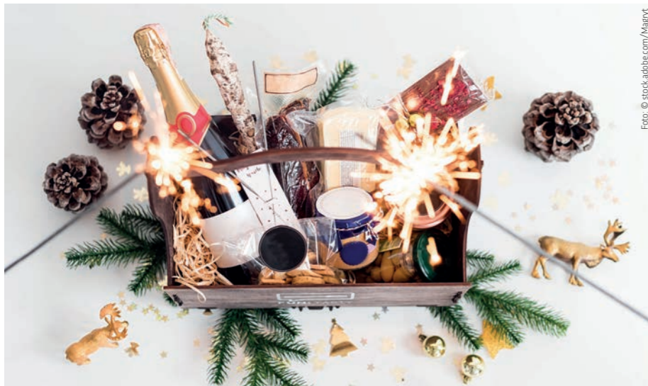
Festlich genießen: eine Weihnachtskiste für bedürftige Familien.

Coronazeit ist Zeit der Hilfe. Dieses gilt für viele Menschen in unserer Gesellschaft. Der „Brackweder Lebensmittelpunkt“ hilft bedürftigen Bürgern wöchentlich mit gespendeten Lebensmitteln. Zum Weihnachtsfest wollen die Organisatoren ihre Kunden mit einer besonderen Akti-