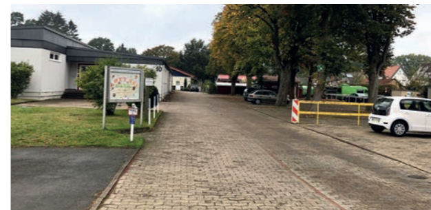
An Wochenenden treiben ungebetene Besucher auf dem Schulhof ihr Unwesen. Ein neuer Zaun soll sie jetzt fernhalten.

Schier unglaublich, auf was für Ideen die ungebetenen nächtlichen Besucher kommen. An einem spätsommerlichen Wochenende hatten Unbekannte auf dem Schulgelände Pflastersteine in Form eines riesengroßen Hakenkreuzes ausgelegt. Seitdem ermittelt die Abteilung Staatsschutz der Bielefelder Kripo. Zwar wurde das verbotene Symbol umgehend entfernt, aber dieser Vorfall war der berühmte Tropfen, der das Fass zum Überlaufen brachte. Schulleiterin Silvia Szacknys-Kurhofer beantragte die Einzäunung ihrer Schule. Die Bezirksvertretung