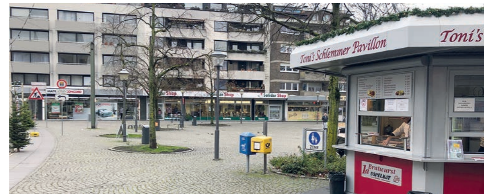
Noch maskenfreie Zone: Der Krisenstab soll prüfen, ob der Treppenplatz mit in die Corona-Schutzverordnung einbezogen werden kann.

Seit Anfang November gilt auf der Hauptstraße Maskenpflicht. Das heißt, nicht nur in den Geschäften, sondern auch unter freien Himmel müssen Mund und Nase mit einer sogenannten Alltagsmaske bedeckt sein. Der Treppenplatz war bislang von dieser Regelung ausgeschlossen, mit der Folge, dass sich viele Passanten die Maske vom Gesicht reißen, sobald sie den Platz erreicht haben. Das wird sich möglicherweise schon bald ändern. Zumindest, wenn es nach dem Willen der Bezirksvertretung (BZV) Brackwede geht. Die hat auf ihrer letzten Sitzung einen entsprechenden Prüfauftrag an den Corona-Krisenstab der Stadt Bielefeld gerichtet. Der wird gebeten, zu prüfen, ob es wohl möglich sei, die Maskenpflicht auf den Bereich des Treppenplatzes auszudehnen.