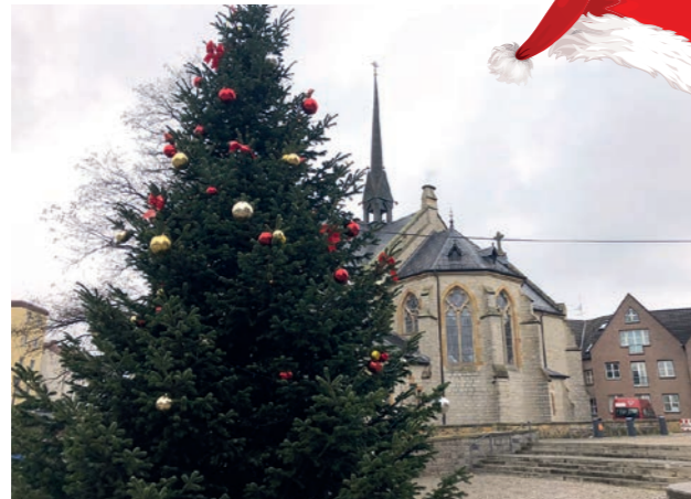
links: Das Loch – Die Baustelle hätte wohl der weihnachtlichen Stimmung Abbruch getan. rechts: Der Baum – Schön geschmückt stimmt er auf das bevorstehende Fest ein.

Auf dem Kirchplatz sorgt derzeit – wie jedes Jahr – ein festlich geschmückter und illuminiertes Tannenbaum für weihnachtliche Stimmung. Was nur Wenige wissen, beinahe hätte es in diesem Jahr keinen offiziellen Brackweder Weihnachtsbaum gegeben. Nicht etwa wegen Corona, sondern wegen einer kleinen Kommunikationspanne. Aber von Anfang an: Am Dienstag, 24. November, um 10 Uhr sollte der zehn Meter große Baum von Mitarbeitern des auf dem Kirchplatz in seine vorbereitete Bodenhülle ein-