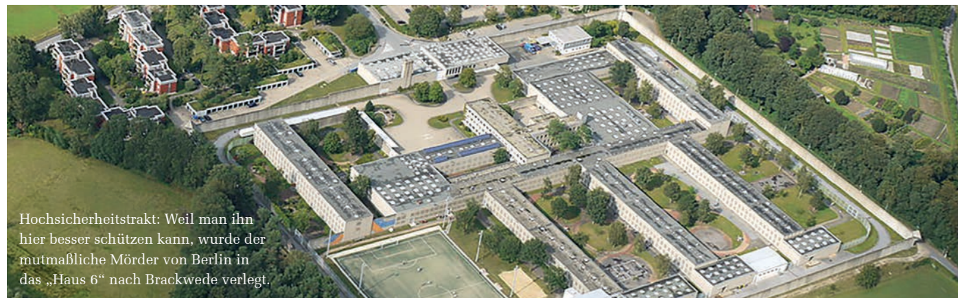
Hochsicherheitstrakt: Weil man ihn hier besser schützen kann, wurde der mutmaßliche Mörder von Berlin in das „Haus 6“ nach Brackwede verlegt.

In Berlin wird derzeit einem mutmaßlichen Mörder der Prozess gemacht. Das ist an sich nichts Ungewöhnliches. Das Besondere an diesem Fall ist, dass der Verdacht besteht, bei dem 55-jährigen handele es sich um einen Profikiller, der im Auftrag der russischen Regierung gehandelt hat. Was nur Wenige wissen: Der Angeklagte saß von Februar bis September hier in der JVA Brackwede-Ummeln in Untersuchungshaft.