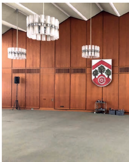
Holz an der Wand: Die Vertäfelung aus den 60er Jahren gilt als Stück „örtlicher Kulturgeschichte“.

Im Sitzungssaal des Brackweder Rathauses zieht es gelegentlich wie Hechtsuppe, die in Würde gealterten Sitzmöbel knarzen unüberhörbar vor sich hin, die Auslegware wirkt stellenweise – na ja – ein wenig schütter, und die Ton- und Bildtechnik fällt auch gelegentlich aus. Kein Zweifel, an dem Raum, in dem die politischen Entscheidungen für unseren Stadtbezirk getroffen werden, nagt unübersehbar der Zahn der Zeit. Das über-rascht nicht, wenn man bedenkt, dass der Sitzungssaal bereits mehr als 55 Jahre alt ist, älter also als die meisten der heute dort