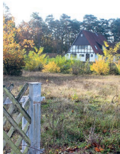
Wildblumen und -kräuter statt Minigolf

Der ehemalige Minigolfplatz an der Friedhofstraße gleicht schon seit geraumer Zeit eher einer Wildblumenwiese als einer Freizeitsportanlage. Ein bunter Bewuchs aus Wildblumen und -gräsern sowie Sträuchern überwuchert das Gelände, auf dem jahrzehntelang Klein und Groß Spaß daran hatten, sich im Wettkampf mit Bällen und Schlägern zu messen. Jetzt soll die Stadtverwaltung prüfen, ob auf dem städtischen Areal möglicherweise ein Klimaschutzzentrum errichtet werden kann. Das hat kürzlich die Bezirksvertretung Senne beschlossen.